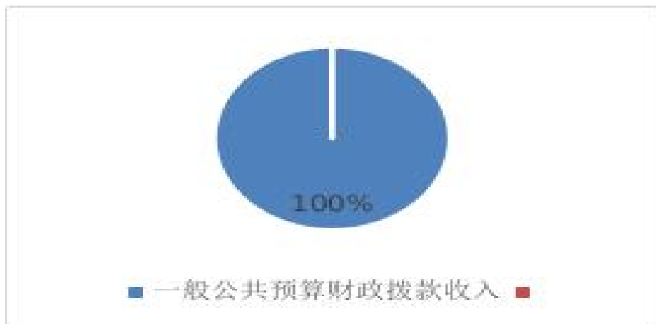
图 1: 收入预算