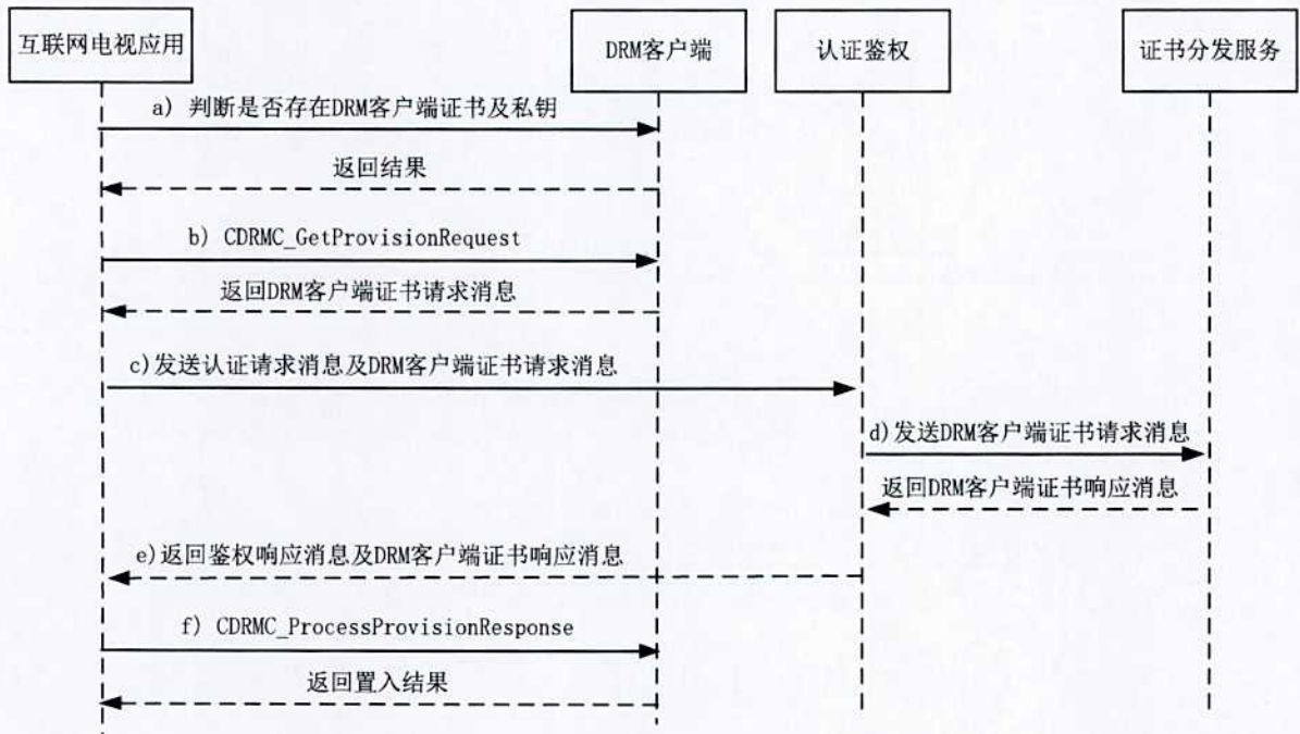
图3 DRM 客户端证书在线置入流程

DRM客户端初始化主要是指DRM客户端密钥和证书的置入。DRM客户端密钥和证书置入分为离线分发和在线分发两种方式。离线分发是指互联网电视终端在出厂前预置DRM客户端证书和私钥, 应符合GY/T 333—2020中9.2的规定; 在线分发方式是指互联网电视应用在第一次启动时从服务端申请DRM客户端证书和私钥, 流程如图3所示。